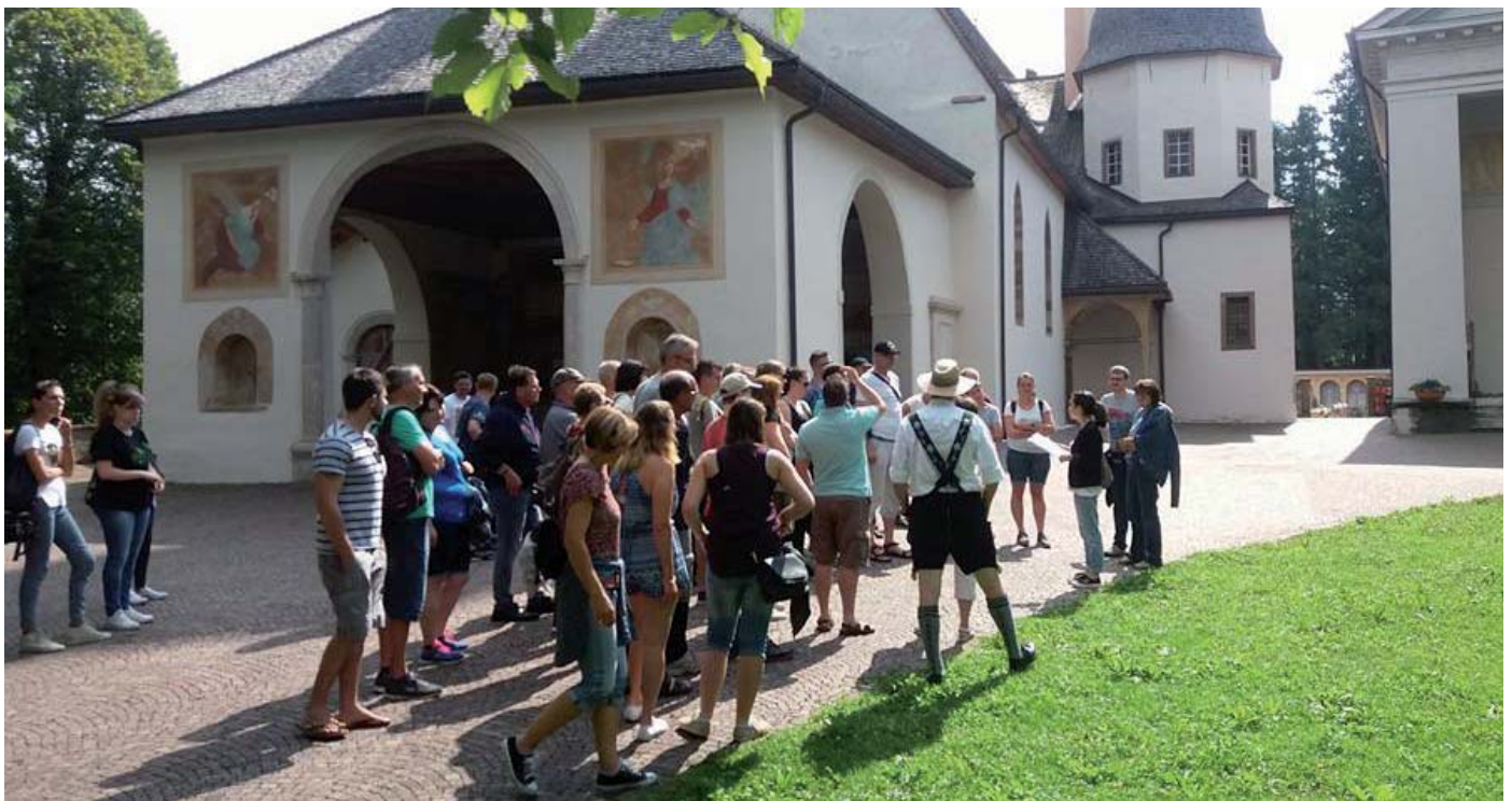
Visita alla Pieve di Santa Maria Assunta a Cavalese.

Mercatino" . Grande rilievo avranno le visite guidate alla mostra "Legno anima di Fiemme" che chiuderà i battenti il 02 aprile p.v, e gli appuntamenti esterni per i quali è stato previsto un ampio programma di valorizzazione che toccherà, in maniera particolare, la Biblioteca Muratori. Per rendervi partecipi di tutti gli eventi abbiamo pensato di inserire, in questo numero del notiziario, l'elenco completo delle attività che verranno divulgate tramite i maggiori canali d'informazione. L'appuntamento è quindi per la stagione invernale e nella speranza di vedervi numerosi vi invitiamo, qualora non l'abbiate già fatto, a visitare il sito internet del Palazzo ( www.palazzomagnifica.eu ) e ad iscrivervi alla nostra news-letter per rimanere aggiornati su tutte le novità che vi attendono.