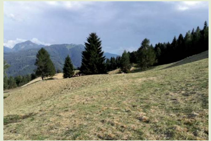
Luglio 2017: vista della parte meridionale dell'area al termine dell'intervento di riqualificazione.

e l'estirpazione delle ceppaie, con successiva asportazione del materiale risultante, il pareggiamento della superficie e lo spietramento dei massi in loco, la semina manuale di specie arboree autoctone con successiva pacciamatura con paglia.