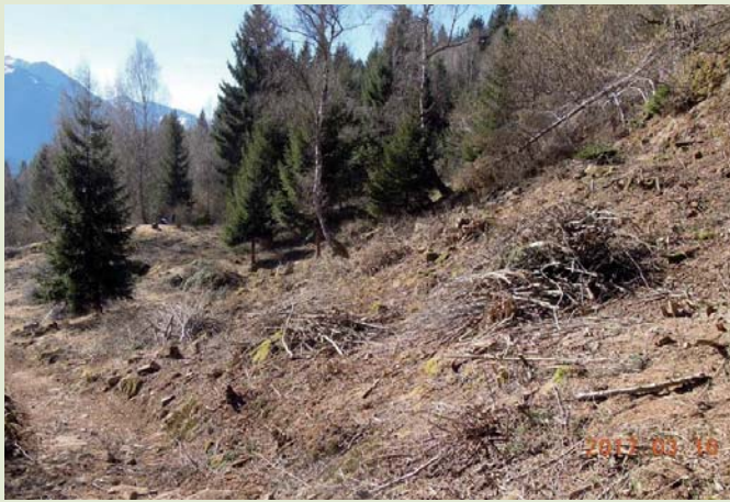
Febbraio 2017: vista della parte meridionale dell'area da sottoporre ad intervento di riqualificazione.