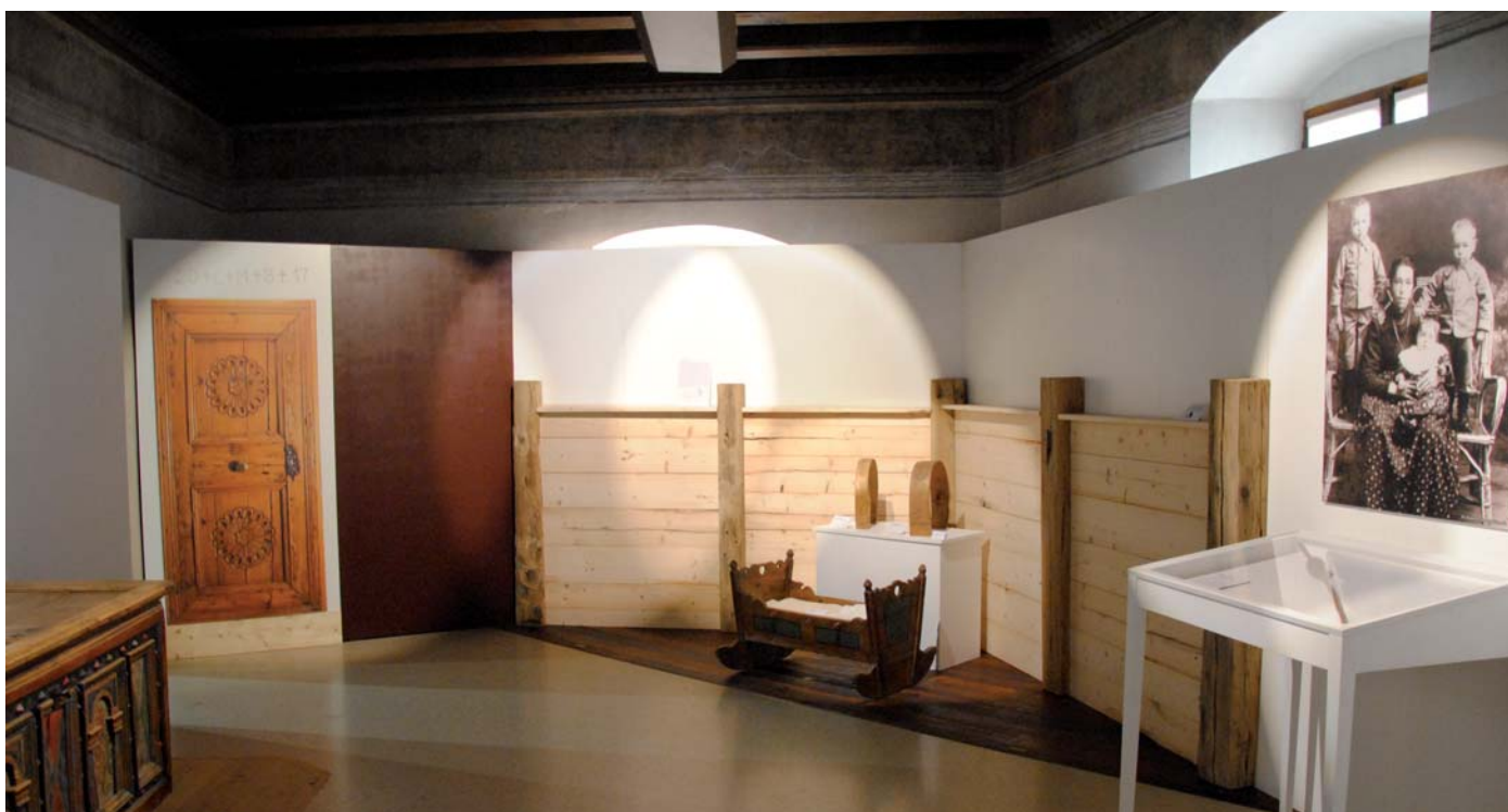
La mostra " Legno anima di Fiemme ".