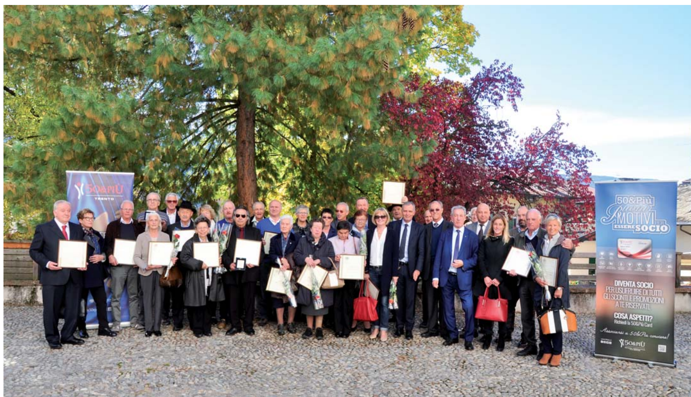
I premiati a Cavalese.