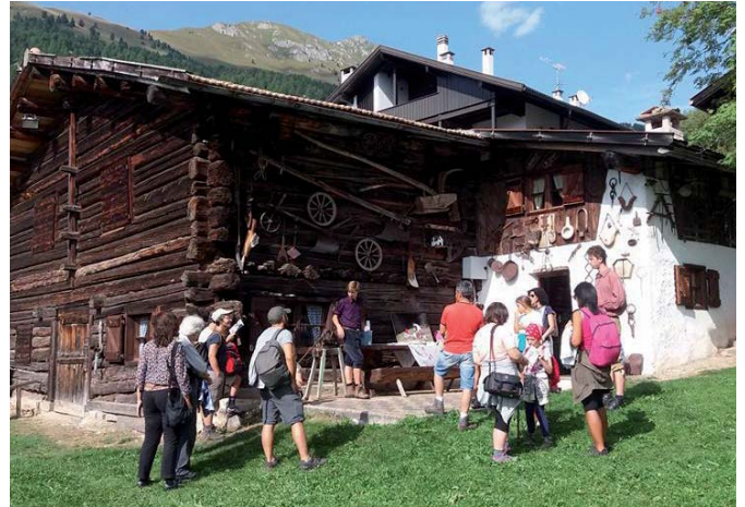
Visita teatralizzata al Museo di Nonno Gustavo.

Mercatino" . Grande rilievo avranno le visite guidate alla mostra "Legno anima di Fiemme" che chiuderà i battenti il 02 aprile p.v, e gli appuntamenti esterni per i quali è stato previsto un ampio programma di valorizzazione che toccherà, in maniera particolare, la Biblioteca Muratori. Per rendervi partecipi di tutti gli eventi abbiamo pensato di inserire, in questo numero del notiziario, l'elenco completo delle attività che verranno divulgate tramite i maggiori canali d'informazione. L'appuntamento è quindi per la stagione invernale e nella speranza di vedervi numerosi vi invitiamo, qualora non l'abbiate già fatto, a visitare il sito internet del Palazzo ( www.palazzomagnifica.eu ) e ad iscrivervi alla nostra news-letter per rimanere aggiornati su tutte le novità che vi attendono.