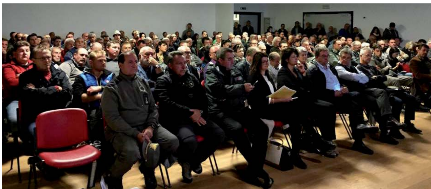
L'incontro sul lupo

In attesa di riscontri concreti e positivi, il Consiglio dei Regolani ha anche pensato alla prossima stagione dell'alpeggio 2018, approvando la costituzione di un tavolo di lavoro con la Forestale per studiare insieme la possibilità di prevedere due/tre punti di raccolta notturna delle manze in recinti protetti da cinque file di filo pastore elettrico, in grado, almeno si spera, di tutelare il bestiame. Un "progetto pilota" che indubbiamente avrà i suoi costi, anche se si chiederà alla Provincia un finanziamento ad hoc per far fronte alla spesa. "Speriamo che questa soluzione dia i frutti che ci attendiamo" ha concluso lo Scario, "e in ogni caso un tentativo va fatto. Non possiamo rimanere con le mani in mano, ma è necessario andare avanti". Non rimane che attendere.