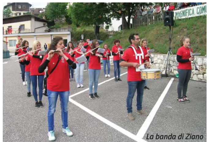
La banda di Ziano