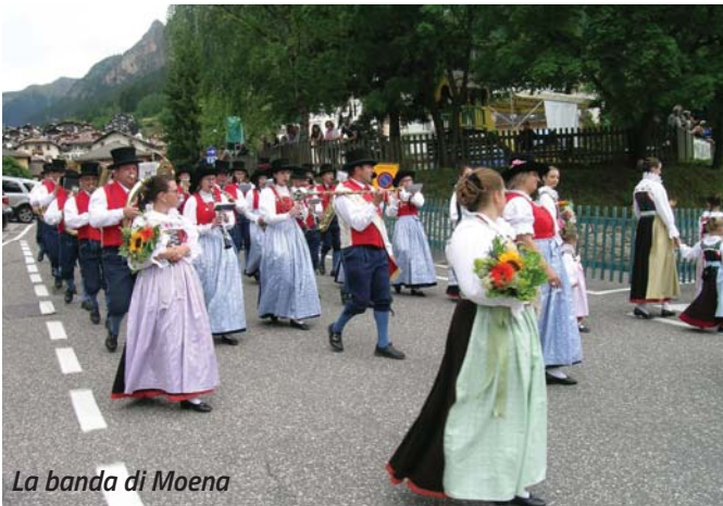
La banda di Moena