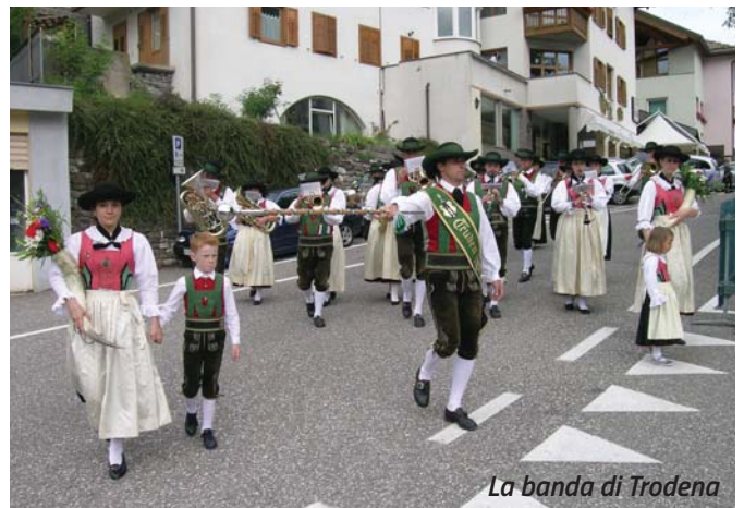
La banda di Trodena