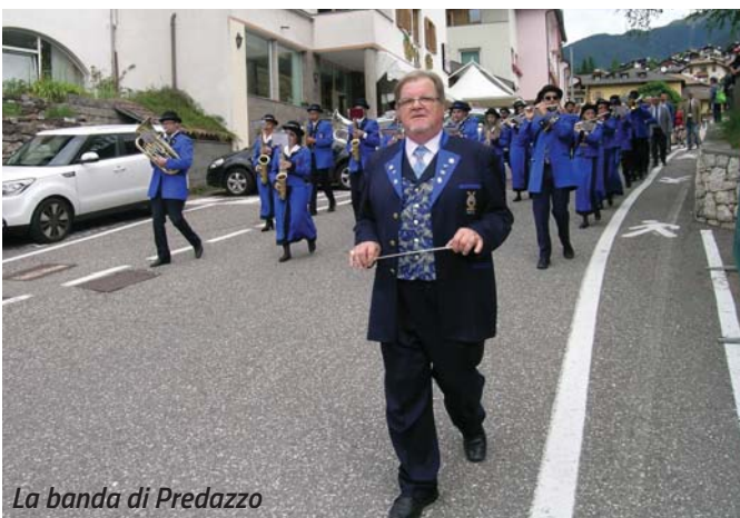
La banda di Predazzo