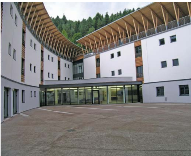
Il piazzale interno ed una camera da letto della nuova struttura