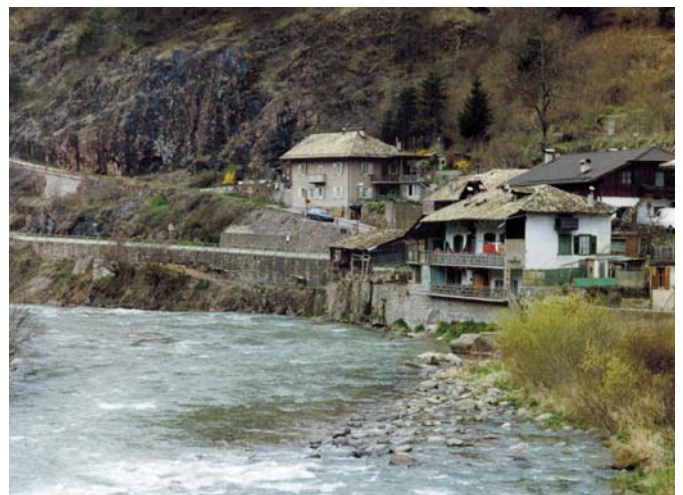
Molina, partenza teleferica a valle