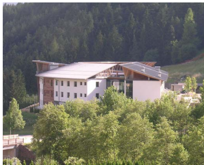
La storica Casa di Riposo "Giovanelli" e la nuova sede