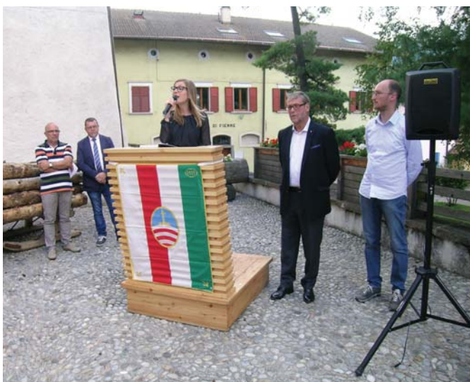
L'inaugurazione della mostra