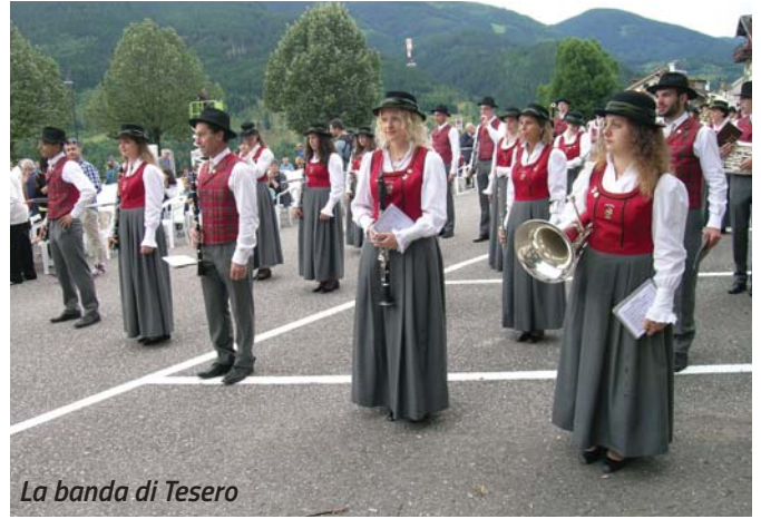
La banda di Tesero