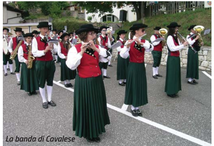
La banda di Cavalese