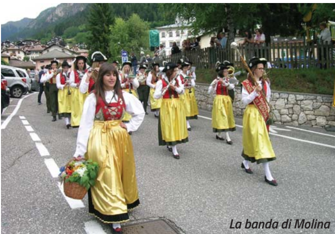
La banda di Molina