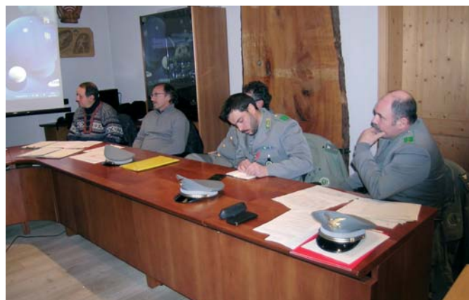
I forestali presenti alla sessione della Magnifica