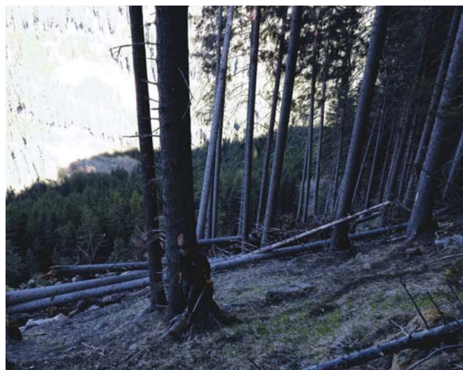
Gli schianti da vento anche se a carattere sparso e comunque con un'intensità bassa hanno interessato alcune aree. Distretto III B.

Nel III Distretto B (Cermis e Lagorai) rispetto ai 2.850 mc del programma iniziale ne sono stati utilizzati 4.428 comportando, anche in questo caso, un supero di ripresa pari a 1.578 mc. L'analisi a livello di singola classe economica palesa come i maggiori prelievi siano equamente ripartiti; in particolare nella classe A si è registrato un supero delle utilizzazioni pari a circa 800 mc (utilizzati 2.265 contro i 1.450 del programma) mentre nella classe B il supero è stato di 769 mc (utilizzati 2.160 contro i 1.400). In entrambi i casi, i maggiori prelievi sono dovuti ad esigenze di utilizzazione che, prevedendo linee d'esbosco lunghe e tecnicamente difficoltose, hanno imposto un'intensità di prelievo maggiore ( "Campiolato, To Causs e Bombasel" ); alcuni lotti si sono invece resi necessari per il verificarsi di schianti da vento (lotto "To dai Sbarboli") mentre il lotto denominato "Via del Bosco", si