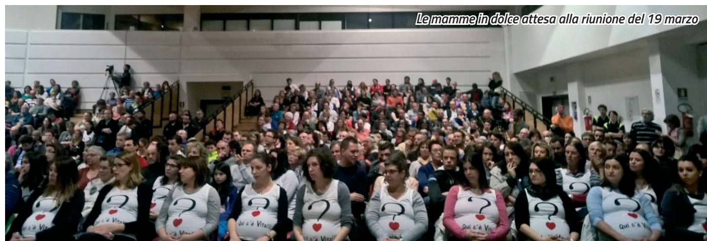
Le mamme in dolce attesa alla riunione del 19 marzo

questo interrogativo, anche se, per adesso, è prioritaria la riattivazione del reparto di ostetricia e ginecologia, la cui chiusura ha determinato in tutti gli abitanti un profondo, giustificato senso di amarezza e di disagio.