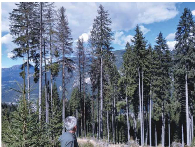
Nel corso del 2016 la situazione legata ai prelievi forzosi è stata nel complesso tranquilla; tuttavia nel corso della tarda estate in alcune aree si sono palesati alcuni focolai di bostrico. Loc. "Cercenai" Distretto IV Ziano-Panchià.

Il II Distretto Cadino (Val Cadino) , nel corso del 2016,