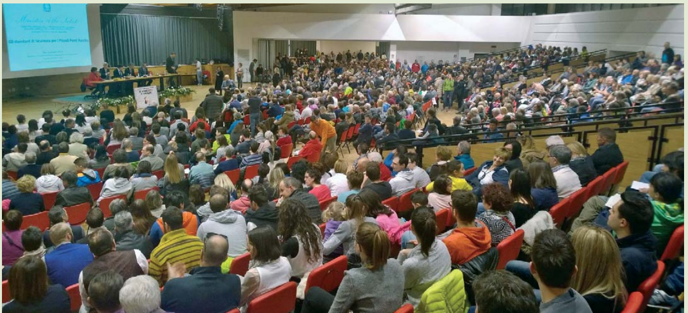
La affollata assemblea pubblica del 19 marzo