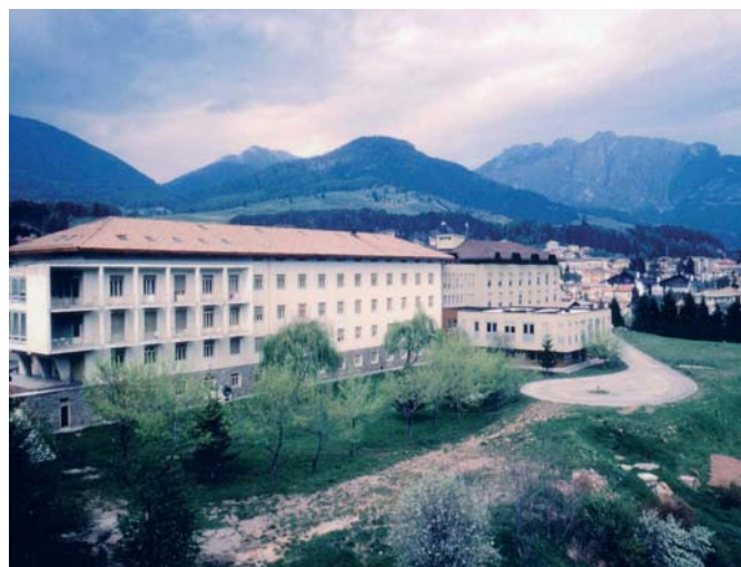
L'ospedale nel 1974

Di una sua ulteriore ristrutturazione si è cominciato a parlare all'inizio degli anni Duemila, con i primi lavori appaltati nel 2002. Poi varie vicissitudini hanno bloccato gli interventi successivi, in un susseguirsi di attese, di speranze, di auspici e di polemiche. A fine estate del 2015 si è cominciato a parlare di un nuovo ospedale. Sarà la volta buona? Difficile rispondere a