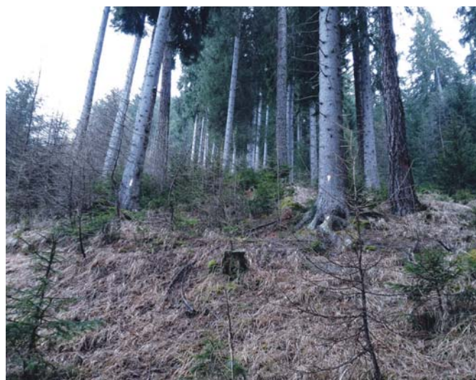
Intervento di sgombero in bosco maturo allo scopo di liberare la rinnovazione in fase di massiccia affermazione.

è reso necessario per consentire i lavori di ampliamento dell'omonima pista da sci.