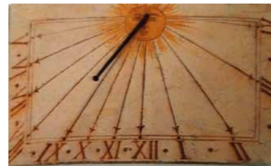
Meridiana sulla facciata del Maso Spianez (post 1749)