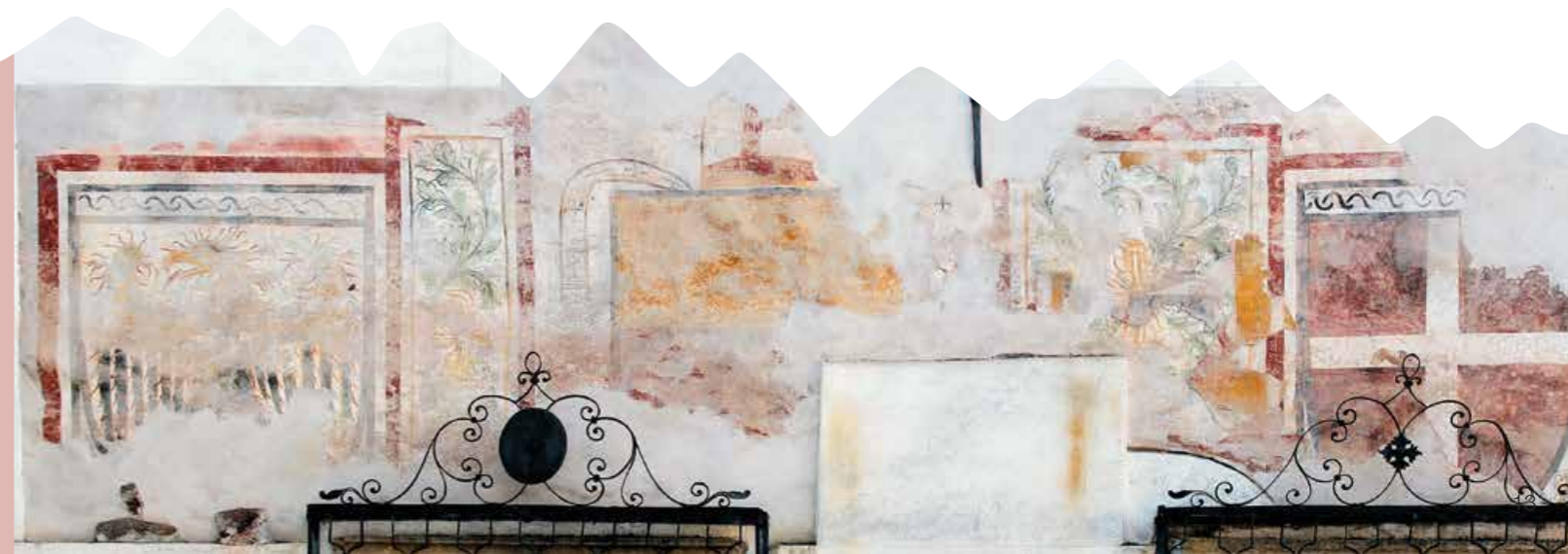
A fianco: tracce dello stemma del vescovo Giorgio di Lichtenstein sulla facciata della canonica.