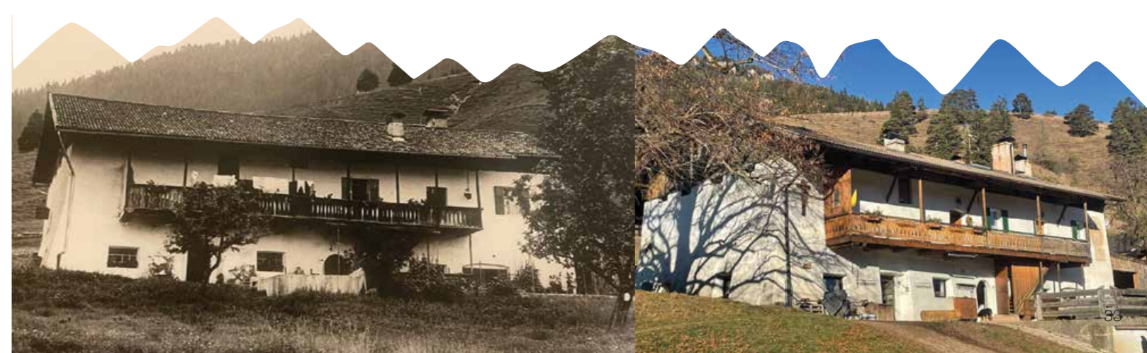
Foto recente del Maso Spianez