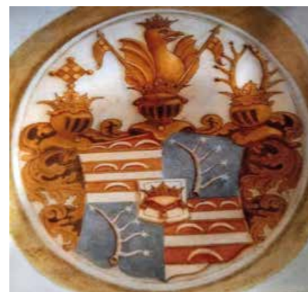
Stemma Firmian sulla facciata del Maso Spianez (post 1749)

Si tratta di un urbario, cioè di un elenco di beni, di una parte dei quali i Firmian, nel 1516, erano già proprietari (il loro palazzo a Cavalese, un'altra casa a Cavalese, Pampeago, il Maso Spianéz, una casa a Pedon-da a Tesero, una casa a Coltura a Tesero, due masi a Stramentizzo, etc.), mentre di