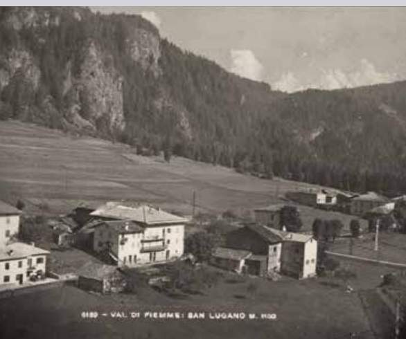
989 - VAL DI FIEMME - SAN LUGANO M. 100

Il 21 gennaio 1926 San Lugano entrava ufficialmente a far parte del Comune di Trodena. È un'occasione che invita non solo a ricordare l'ultimo secolo, ma anche a riscoprire la storia più profonda e sorprendente di questo piccolo paese sul passo, una storia fatta di autonomie, aggregazioni e scelte comunitarie che hanno segnato la sua identità. Sul prossimo numero del notiziario della Magnifica Comunità di Fiemme ripercorreremo le tappe della storia di questa frazione, che ha mantenuto la sua identità linguistica italiana all'interno di un territorio a maggioranza germanofona, una peculiarità che affonda le radici nella sua lunga appartenenza storica alla Val di Fiemme.