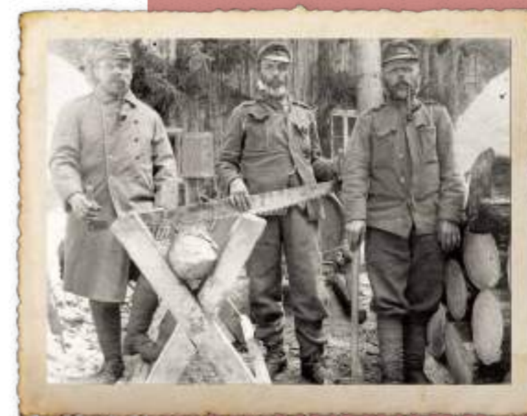
Operai militarizzati intenti nel taglio del legname, 1916

Tra i danni collaterali si ricorda anche un'importante infestazione da Ips Typographus (bostrico), che portò all'abbattimento di circa 200.000 metri cubi di legname.