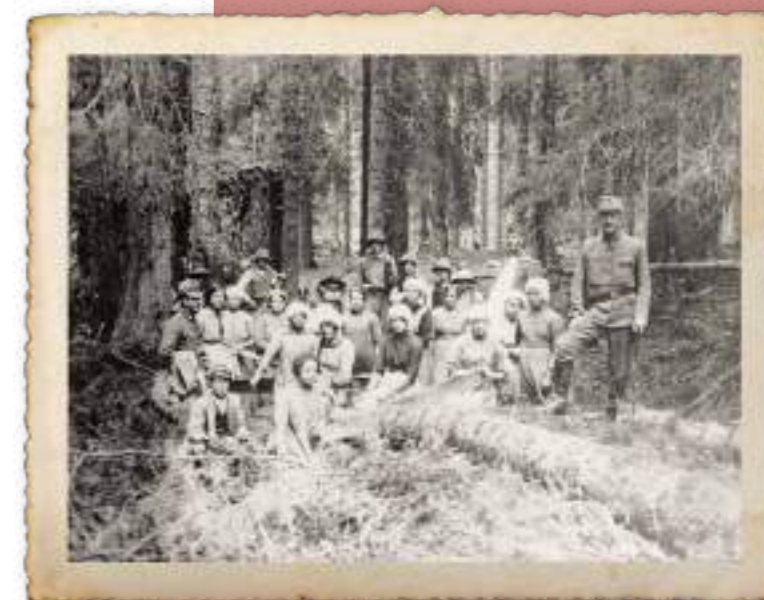
Donne e ragazzini di Ziano a far legna con i soldati austriaci in località "alla Busa", probabile 1916-1917