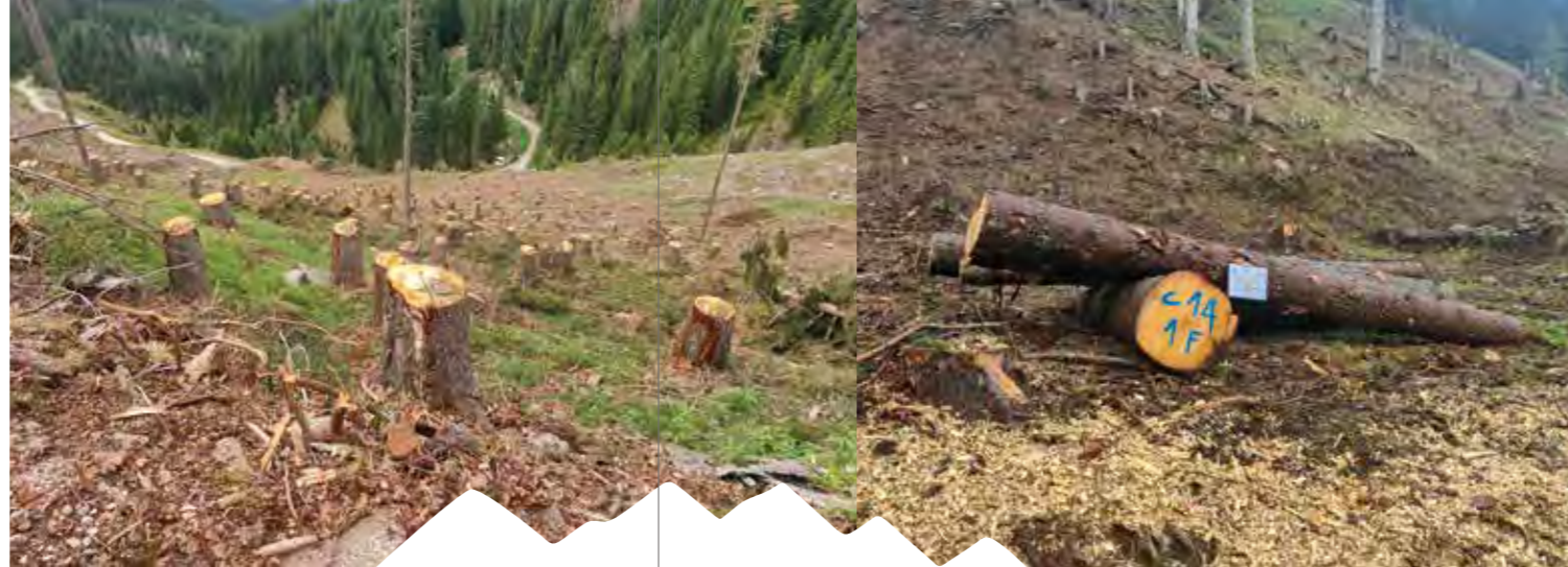
Area interessata dal prelievo del legname bostricato con rilascio delle ceppaie "alte" allo scopo di garantire la protezione della pista sottostante dal distacco di valanghe (Cermis Cavalese, Via del Bosco)

Durante il periodo estivo, in particolare nel mese di luglio, anche i boschi della Magnifica sono stati interessati, seppur marginalmente, dai danni provocati dalla tromba d'aria (la "piccola Vaia" come è stata definita nel vicino Veneto); i danni hanno interessato soprattutto l'area di Paneveggio e di Moena. Nel complesso, l'impatto provocato al patrimonio boschivo ammonta a circa 5-6.000 mc. Nel corso della tarda estate/autunno del 2023 si sono iniziati in maniera tempestiva i lavori di recupero del materiale in questione, soprattutto nell'area di San Pellegrino (Loc. "Ciadinon"), dove gli schianti hanno interessato boschi caratterizzati da ottima qualità del legname.