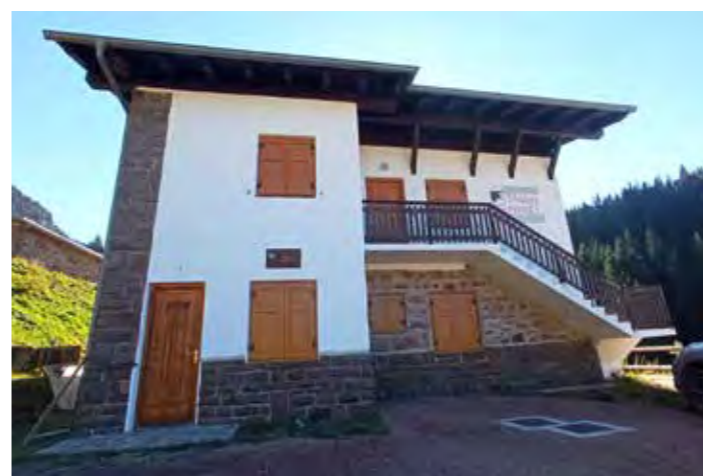
Malga Cadinello, agriturismo

ma struttura Malga Cadinello. L'edificio si trova lungo i tornanti della S.P. 31 che da Molina di Fiemme conduce al Passo del Manghen. Negli anni dal 2019 al 2023 è stato sottoposto a lavori di manutenzione straordinaria per ricavare, al primo piano della struttura, 16 posti letto suddivisi in tre camerette con bagni in comune, e un alloggio per il gestore. Al piano inferiore due salette con panche e tavoli accolgono gli ospiti per le prime colazioni o per piatti freddi, merende e spuntini. Sempre nell'ambito del programma TransLagorai, la Provincia ha finanziato la ricostruzione del baito dei pastori , che si trova poco a monte dell'agritur. L'energia elettrica è fornita da un impianto fotovoltaico e le acque sono smaltite con una vasca Imhoff, munita anche di degrassatore, adeguatamente dimensionata. Nel complesso la spesa sostenuta ammonta a 251.379,59 € (esclusa l'IVA) sulla quale la PAT è intervenuta con un contributo di 141.600,00 €. La progettazione e la direzione lavori sono state affidate all'ufficio tecnico forestale della Comunità.