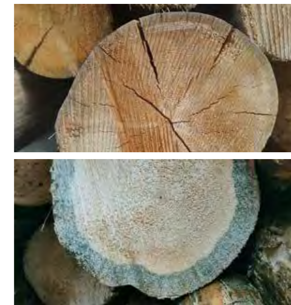
Legno azzurrato a causa dell'attacco del bostrico

Il numero dei lotti boschivi realizzati nel 2023 è stato pari a 125; gran parte del lavoro di taglio ed esbosco del legname (circa l'80%) è stato affidato a ditte boschive della Val di Fiemme, con un'importante ricaduta positiva sull'aspetto socio-economico della valle. La rimanente parte è stata comunque affidata a ditte italiane che garantiscono standard lavorativi molto alti.