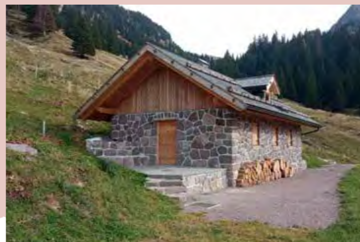
Malga Cadinello, baito dei pastori

Partendo dalla punta ovest della catena montuosa, nel territorio della Magnifica Comunità di Fiemme si incontra come pri-