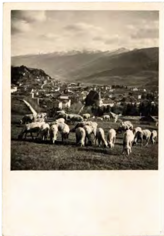
pecore al pascolo sui prati di Cavalese, probabili anni Cinquanta