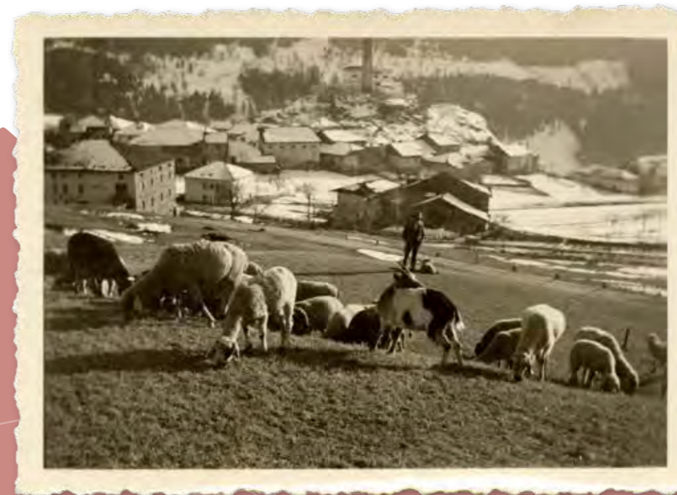
Bestiame minuto al pascolo sui prati di Castello di Fiemme, probabili anni Trenta

L'intenzione dello scrivente sarebbe quella di approfondire la tematica e di stendere un profilo di questa storia della "transumanza primaverile" delle pecore di Fiemme sulle paludi dell'Adige, con dei dati maggiormente circostanziati in merito a questa secolare attività praticata dai pastori di Fiemme. ▲